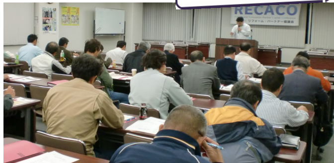
【千葉会場 第1回説明会・義務講習A(44人が参加)】

(千葉県松戸市仲井町3-104-2) ※駐車場に限りがございます。公共機関でのご来場をお願いいたします