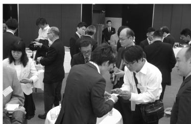
今年の4月に行われた名刺交換会

千葉土建では建設業者のつながりを深め各々の仕事の幅を広げるとりくみをしています。今年の4月には名刺交換会を開催し、多くの業者が集まり、活発な会にすることができました。ぜひご参加ください。